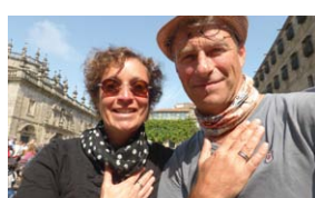
10 Jahre auf dem Jakobsweg