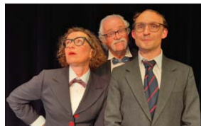
Der verstimmte Elefant – Kultabend