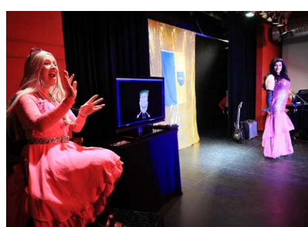
LSDS – Lübbenau sucht den Superstar – Eine Revue zum Wegschmeißen von Matthias Härtig