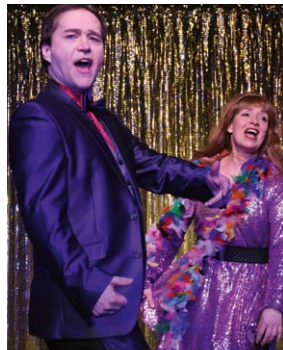
NeuRosen mit Schuss!

... und jetzt noch ein Vorgeschmack auf den Monat Juli: