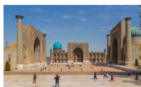
Geheimnisvolles Usbekistan