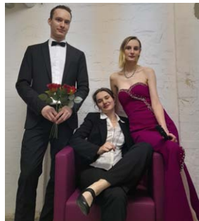
Liebe? Leid? Tod? – Hauptsache Oper!