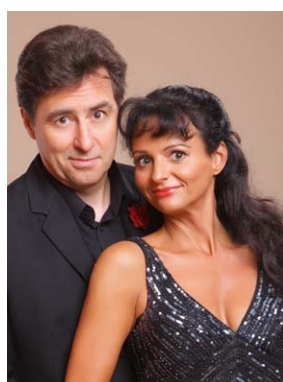
Operetten zum Kaffee